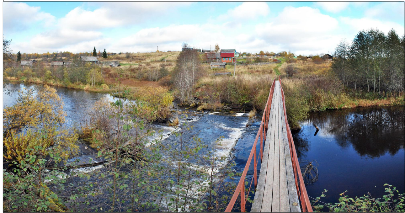
Фото р.Тихвинка в д.Плутино. 2009г., октябрь.